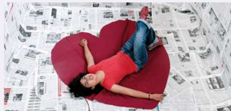
BRÜCKE ZUM SELBST FRAU SEIN - MIT BEHINDERUNG Mehr Fotos aus der Fotowerkstatt des Heilpädagogischen Therapie- und Förderzentrums St. Laurentius-Warburg unter: www.hpz-st-laurentius.de/hpz+st.+laurentius-warburg/startseite/mitmachen/kultur/fotoworkshop/

Das Thema ist mit Schwere und vielen Schattenseiten besetzt: Sexualität und Behinderung von Frauen schließt allzu häufig sexuelle Gewalt mit ein. Obwohl wir das sehr ernst nehmen, möchten wir den Blick auch auf die positiven Aspekte lenken und auf die Teilhabe behinderter Frauen am gesellschaftlichen Leben eben in Liebe, Partnerschaft, Erotik und Sexualität hinwirken. Dafür haben wir 2008 mit der Plenumsveranstaltung „Lustvoll leben!“ einen großen Schritt getan. Die positive Resonanz und der Wunsch nach weiterem Dialog geben unserem Ansatz Recht.